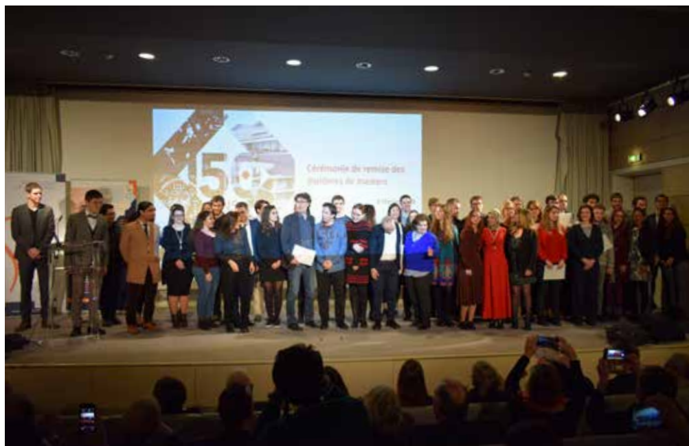
Cérémonie de remise des diplômes de master, le 8 février 2018

Articulée à un projet professionnel conduisant prioritairement aux carrières de l'enseignement supérieur, de la recherche et du patrimoine, la formation de master EEMA est aussi adaptée, dans le cadre d'un double cursus ou d'un cursus complémentaire et spécialisé, à des étudiants orientés vers les secteurs professionnels de l'édition, la documentation, la presse, la gestion et la communication culturelles.