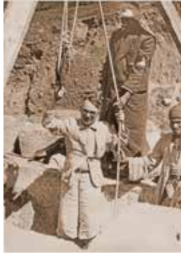
Pierre Montet à Tanis, en 1940