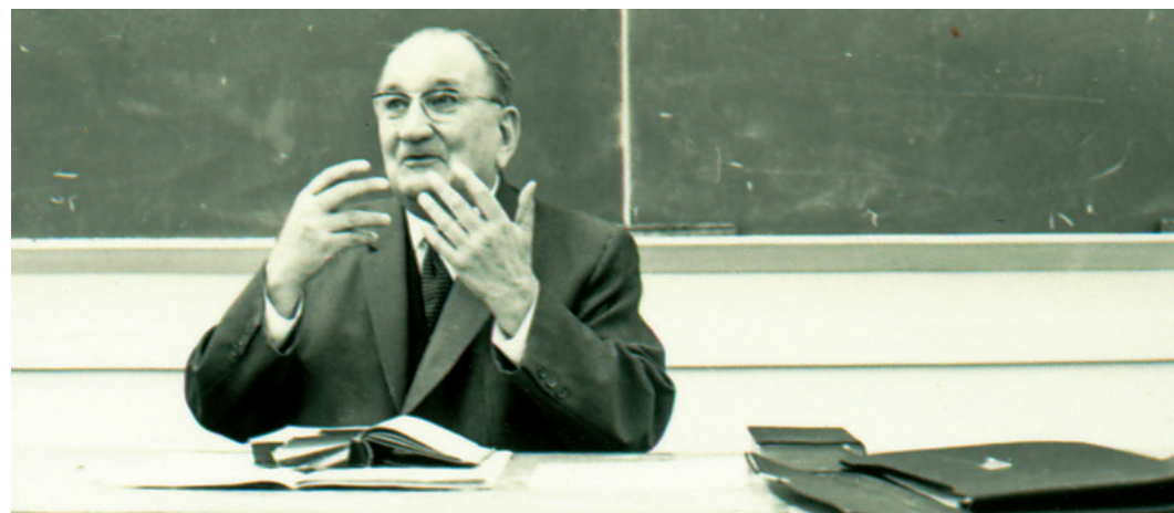
Étienne Gilson enseignant à Berkeley, Californie, 1969